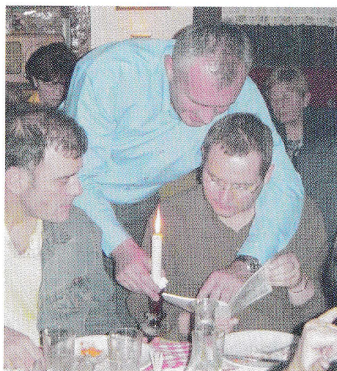
Sem vam rekel, da se nasmehnite, ker nas bodo Slovenci vtaknili v svoj bilten!