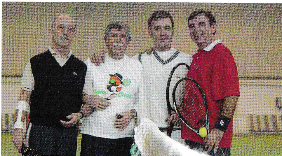
Igrala sva obrambo dveh skakačev.