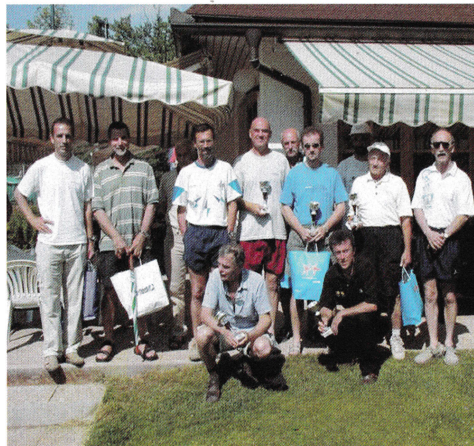
Veteransko prvenstvo Slovenije Kranj, 23.-25. 5. 2003