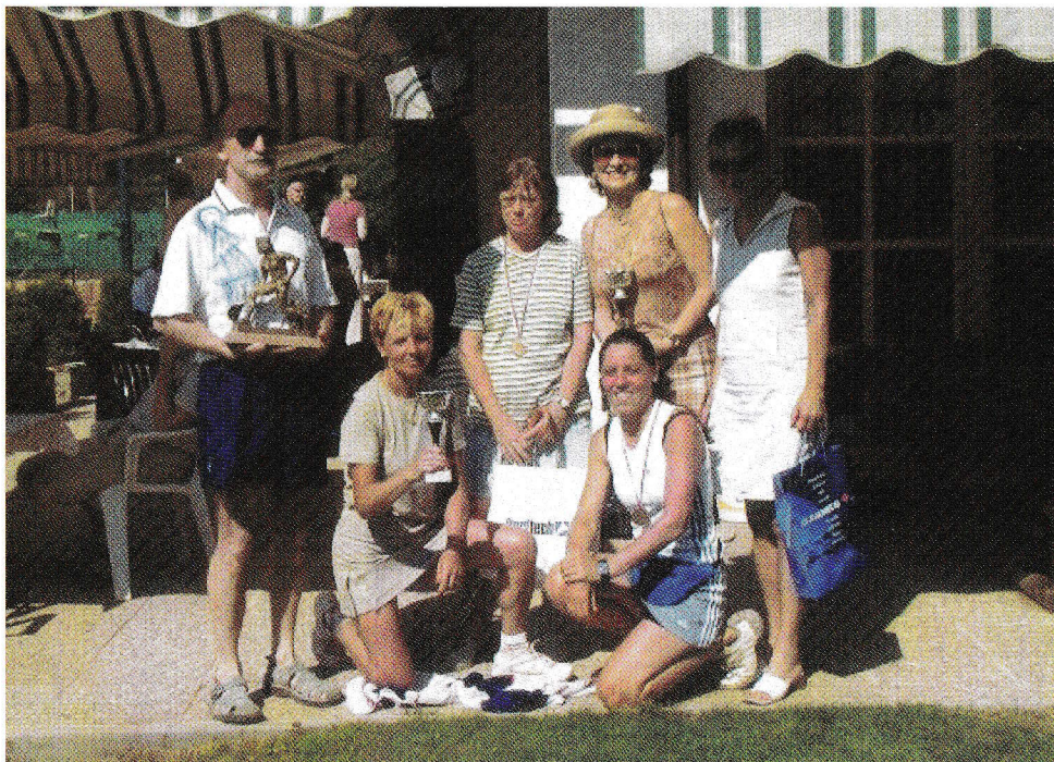
V Kranju pod Triglavom.