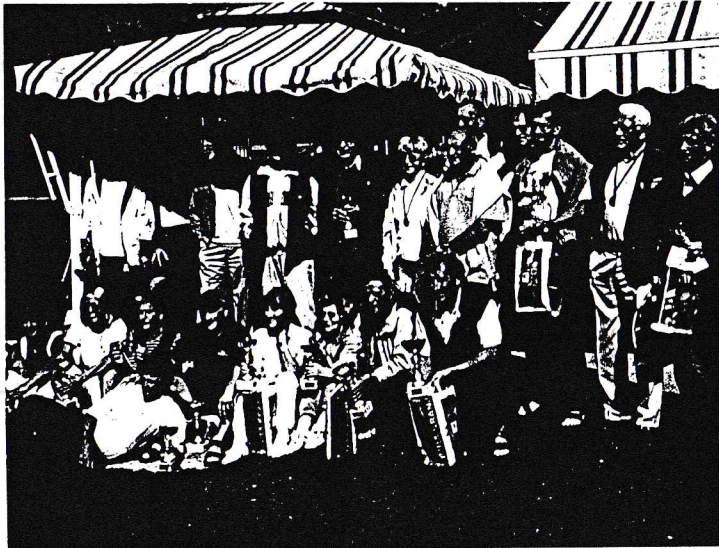
Navdušeno razpoloženi nagrajenci državnega prvenstva leta 2000 v Kranju