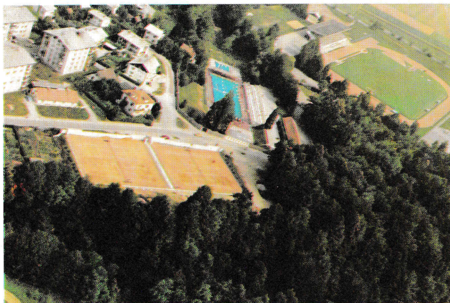
Novi teniški park