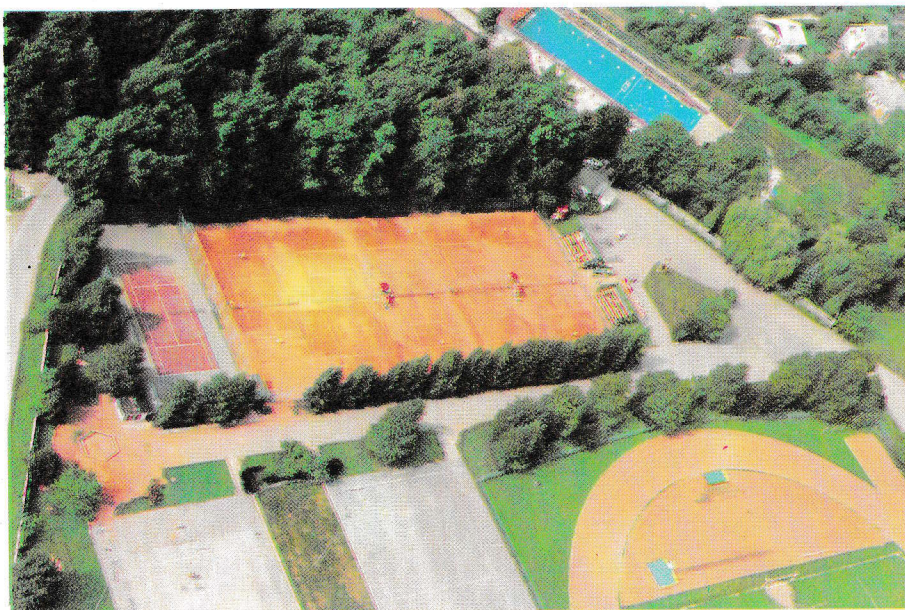
Stari teniški park